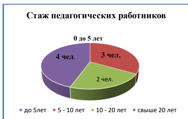
Диаграмма с характеристиками стажа работы кадрового состава