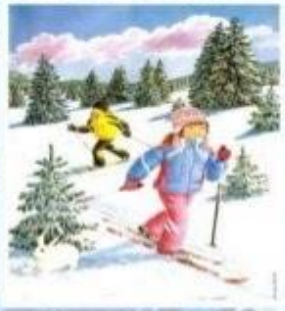
Катание на лыжах.